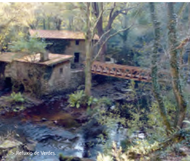
> Refugio de Verdes.

Nuestra próxima parada nos llevará río abajo, hacia la desembocadura del Anllóns situada entre los Ayuntamientos de Ponteceso y Cabana. Aquí el caudal forma una ensenada de gran valor paisajístico y ecológico que ocupa más de un millar de hectáreas dando forma a la cabecera de la ría de Corme y Laxe. Para llegar hasta el paraje, de vuelta en la AC-552, seguimos dirección Fisterra y pasado el casco urbano de Coristanco y el de Agualada, cogemos el desvío a la derecha a Buño, continuamos hacia Ponteceso y cogemos la carretera a Corme. En el lugar de O Couto, a un kilómetro del casco urbano, tomamos una pista a la izquierda. Es conveniente hacer la visita a pie para ver los diferentes ecosistemas de la zona: la marisma, la llanura intermareal, las dunas, las playas y sobre todo el paisaje del monte Branco, que debe su nombre a la arena del estuario que cubre la ladera que encara la ría.