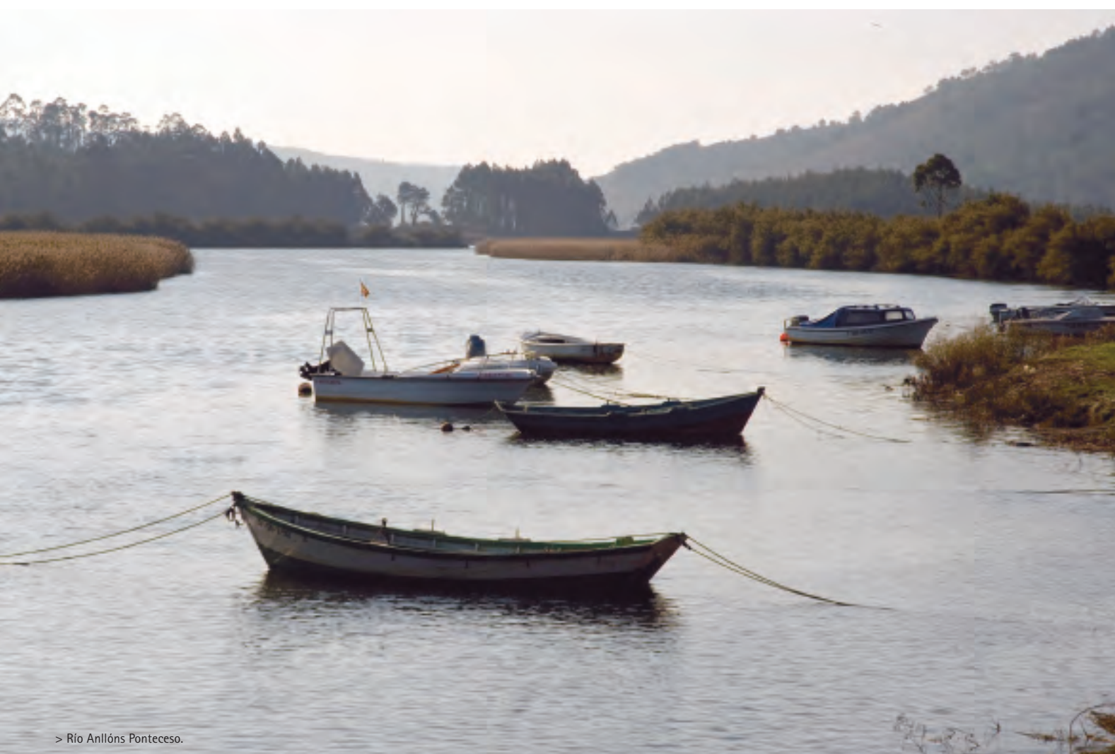
> Río Anllóns Ponteceso.

El municipio de Cabana guarda dos de los monumentos megalíticos de la "Costa da Morte". Para llegar hasta ahí, desde nuestra anterior parada continuamos hasta Neaño y cogemos la carretera a Baio. En la mitad del camino, encontramos el indicador "A Cibdá de Borneiro" y un poco más adelante el "Dolmen de Dombate".