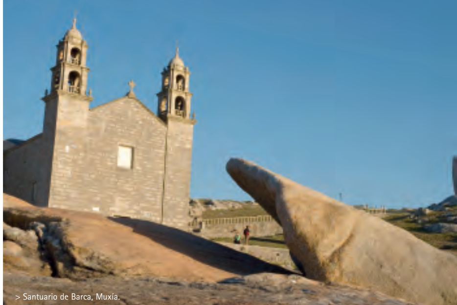
> Santuario de Barca, Muxía.