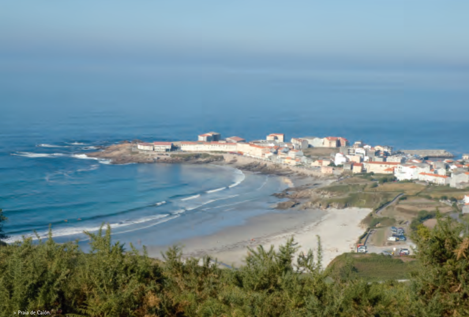
> Praia de Caión.

Para llegar a Caión (A Laracha), bien se puede hacer desde la capital municipal o desde la AC-552 a su paso por Arteixo en donde hay que tomar el desvío hacia Barrañán. Tanto escogiendo una como otra alternativa, las panorámicas de la pequeña península caionesa desde la carretera son impresionantes. Ya en el pueblo es obligado un paseo por la playa de As Salseiras, muy popular en verano, y a donde se accede desde el paseo marítimo. Monumentos destacables son la iglesia del Perpetuo Socorro y el derruido pazo de Graxal (siglo XII), que está previsto restaurar por sus actuales propietarios. Al continuar la ruta por la carretera hacia Carballo, se puede aprovechar para visitar el santuario mariano de Os Milagres en donde cada 8 de septiembre se celebra una de las dos romerías más populares de la Costa da Morte junto con la de A Barca de Muxía.