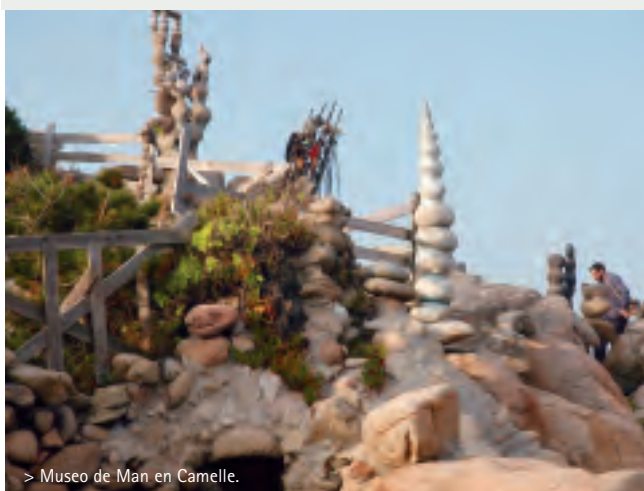
> Museo de Man en Camelle.

Continuaremos ahora hacia Muxía por la comarcal, villa en donde está situado el santuario mariano de A Barca